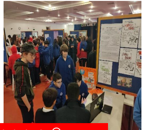
Sergi alanından farklı projelerin izleyicilerle buluştuğu anlardan kareler 😊